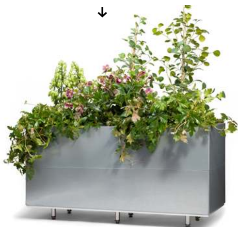
120 x 40 x 50h med bunn og ben