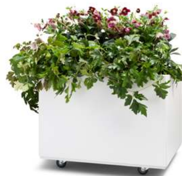
60 x 60 x 40h – sort/hvit lakk med bunn og hjul