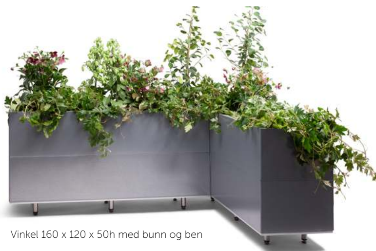
Vinkel 160 x 120 x 50h med bunn og ben